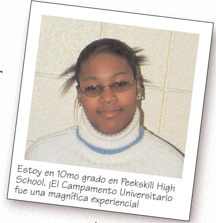
Estoy en 10mo grado en Peekskill High School. ¡El Campamento Universitario fue una magnífica experiencia!

Mi experiencia en el Campamento Universitario me afectó de manera muy positiva. Me demostró cómo sería mi futuro en la universidad y me di cuenta que si tomo tiempo para prepararme ahora podría alcanzar un futuro mejor en mi vida.