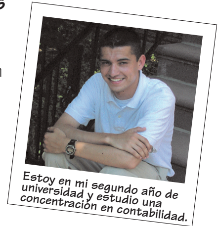
Estoy en mi segundo año de universidad y estudio una concentración en contabilidad.